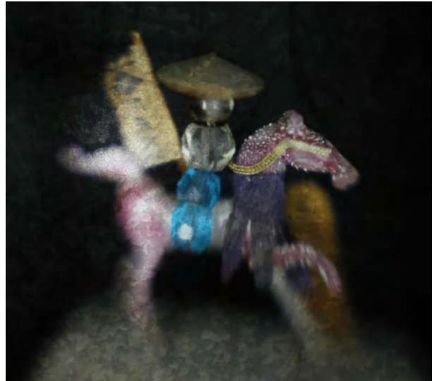
幻燈工場 2020 中里和人