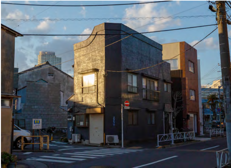
光ノ箱庭 2020 牧野雄気