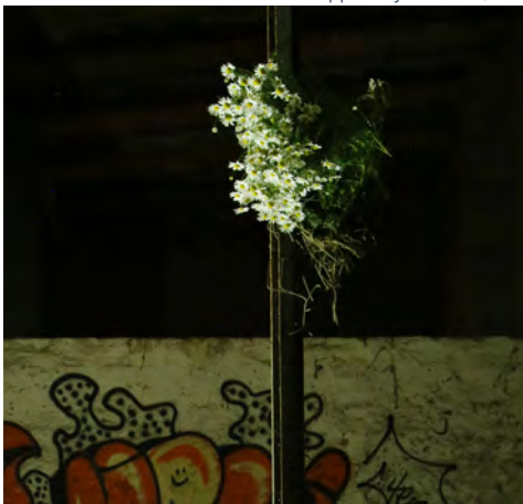
上野雄次 花いけ ドイツ・ライブチヒ

東京プロジェクト： 墨田区向島には、長屋、町工場、路地、軒先園芸など、ヒューマンスケールから形成された、東京という都市の原風景が色濃く残っている。その原風景を、明治初期に一時存在した東京（トウケイ）と呼ばれた幻の東京に重ねながら、向島エリアに潜在化している幻の景観＝東京を撮影し、写真展やシンポジウムなどを通じ、未来に伝える東京の景観遺産（原風景）として社会に発進させていく。会場となった元建具屋さんの工場には、今も都市の原風景＝東京の痕跡が随所に残っている。その痕跡や記憶と町景観の写真を醸成させ〈東京原風景ミュージアム〉を出現させるプロジェクト。