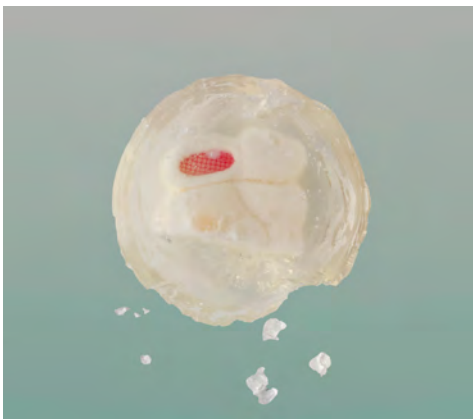
Have a Cuppa Jelly 2020 馬天航