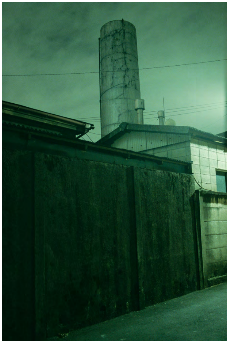
写真集『東京』(木土水)